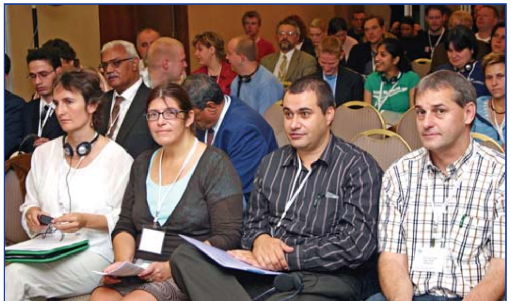
Die erste UNI-Konferenz für Beschäftigte von Callcentern wurde im Oktober 2005 in Athen mit Unterstützung der Arbeitnehmergruppe der Internationalen Arbeitsorganisation (ACTRAV) abgehalten