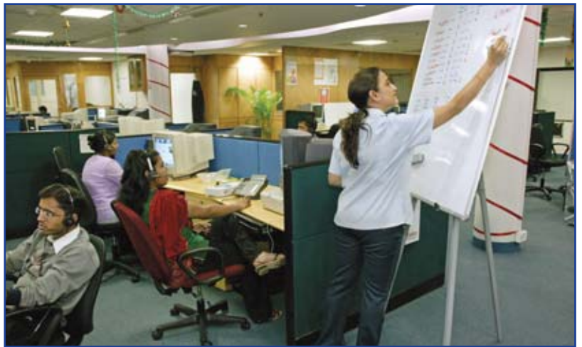
Im Callcenter von Transworks in Mumbai, Indien, wird ein Target-Board aktualisiert

Eine Umfrage bei den Kunden zeigte, dass sich 90% der Leute ärgern, wenn sie mit Personal sprechen, das offensichtlich von einer Textvorlage abliest. Die meisten Kunden meinten, dies führe dazu, dass das Personal nicht zuhört oder die Fragen nicht richtig beantwortet. Das Personal bekommt nun Schablonen, die es durch die für das Gespräch mit den Kunden benötigten Hauptpunkte leitet.