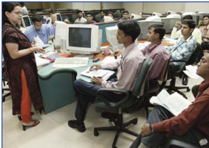
Ausbildung neu eingestellter Beschäftigter: Infowavz Mumbai, Indien

UNI-Europa leitete das MOOS-Projekt (Auslagerung ins Ausland verträglich gestalten) ein. In den ersten sieben Monaten des Projekts wurden 15 600 ausgelagerte Arbeitsplätze sowie 14 300 neue Arbeitsplätze ausfindig gemacht. Die meisten Arbeitsplätze gingen nach Indien, Irland, Ungarn und andere EU-Länder, hauptsächlich in den Bereichen IT-Dienste, Softwareentwicklung, Konstruktion und Buchführung. MOOS wird aus dem Sozialfonds der Europäischen Kommission finanziert, wobei Gewerkschaften in sechs europäischen Ländern bisher regelmäßig über Auslagerungsmaßnahmen berichten. Die nächsten Schritte im MOOS-Projekt sind die Entwicklung eines Handbuchs zur Bewältigung der Auslagerung und die Entwicklung von Ausbildungslehrgängen für Gewerkschaftsvertreter/innen. Globale multinationale Unternehmen (u.a. Fluglinien, Banken und IT-Unternehmen) lagern hauptsächlich Kundendienstarbeit aus, sowohl in unternehmenseigene Betriebe als auch in Vertragsunternehmen. Zu den wichtigsten globalen Akteuren gehören in dieser Hinsicht Accenture (USA), SNT (Niederlande), Atento (Spanien) und Convergys (USA). Es ist ein deutlicher Trend vorhanden, kostspielige Regionen der Welt zu verlassen und in Regionen vorzustoßen, in denen das Lohnniveau niedriger ist und die Beschäftigungsbedingungen und Arbeitnehmerrechte schlechter sein können.